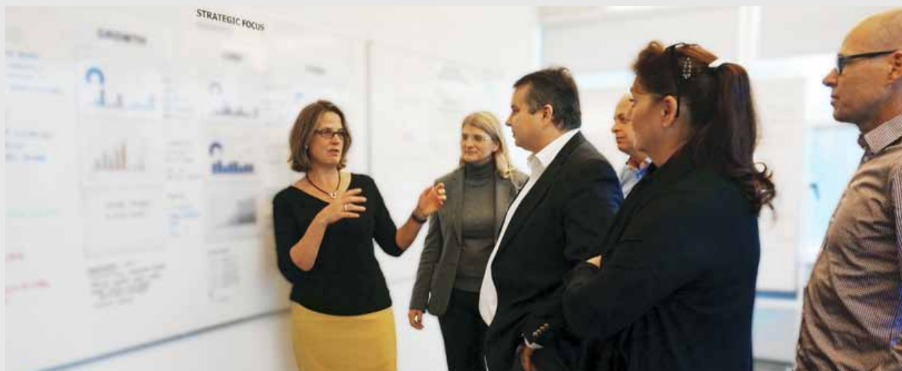
I "Biografen", Business Improvement Office, träffas koncernledningen regelbundet för att följa genomförandet av strategin. Uppföljningen baseras bland annat på framtagna relevanta mätetal.

riskbedömning, kontrollaktiviteter, information och kommunikation samt uppföljning.